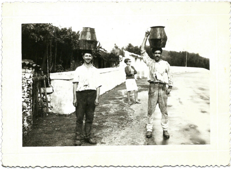
50s / 60s